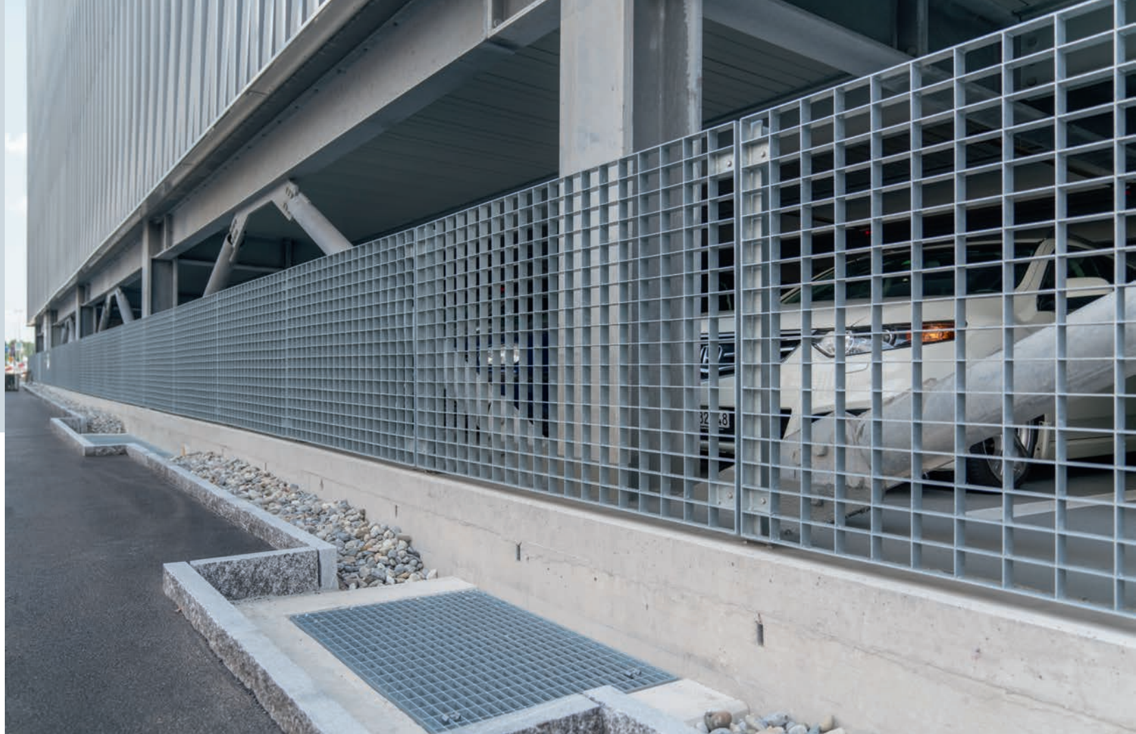
Rund 400 m 2 Gitterroste von 6,9 Tonnen kleiden Teile des Parkhauses ein.