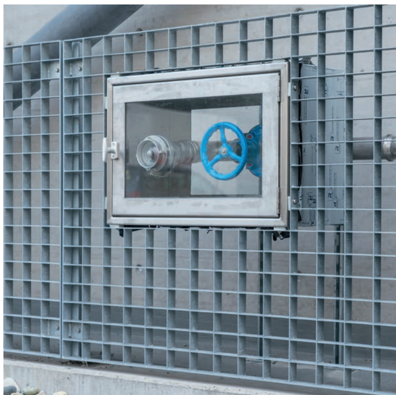
Spezielle Gegebenheiten forderten spezielle Lösungen.